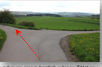
9 vorbei an einem herrlich ruhigen Tälchen u. Streuobstwiesen – super Blick ins Würmtal und in den Schwarzwald