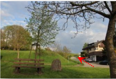
1 Startpunkt und los an den 3 Linden vorbei