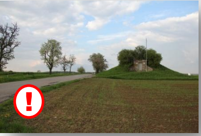
8 „Hoher Markstein“ – rechts das Wasserreservoir, links die Obstanlage, super Weitblick, vorsichtig über die K 1007 !