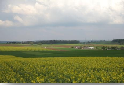
7 Rundblick auf der Hochfläche genießen ! Rechts die Fuhrmannhöfe u. Ihinger Hof, links das Sportgelände des TSV Schafhausen