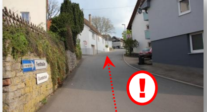
12 steiler Schlussteil zum Ausgangspkt .zurück