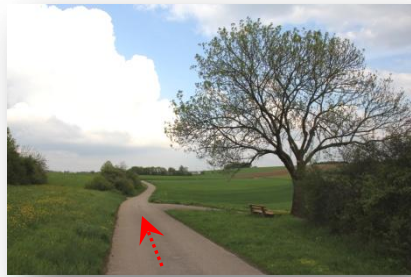
2 Aufwärmphase mit Blick ins Würmtal ...