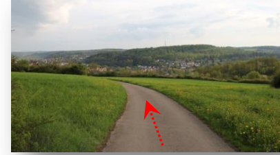
10 bergabwärts, toller Blick auf Schafhausen