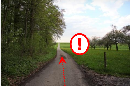
6 .. geradeaus durch, vorsichtig über die L1189 !