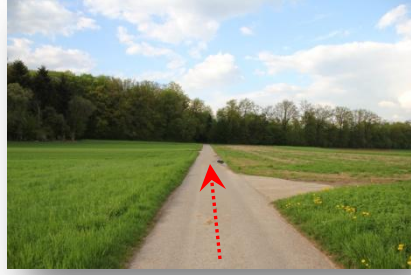
5 ... Richtung Härtle (Wald), den „Diebsweg“