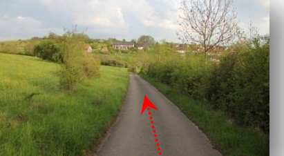
11 über „Hinter Höfen“ zurück über die L1189 !