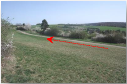
3 ... und der typischen Heckenlandschaft