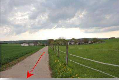
4 vorbei an den Seitenhöfen, links ab...